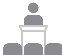
Apoio e Promoção dos Segmentos Econ