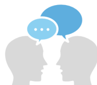
Articulação com Setores Econômicos