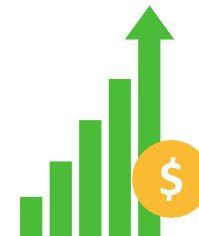
Suporte à Concessão e Operacionalização de Incentivos Fiscais