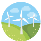
Atlas Eólico e Solar