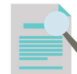
Monitoramento das empresas incentivadas pelo FDI