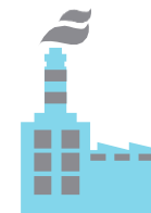
Infraestrutura para Negócios